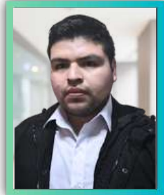
Data Analytics en INDRA