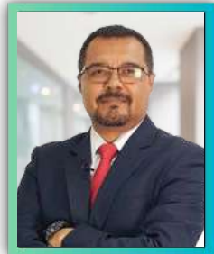
Past. Director de Gestión de Inversiones del MTC