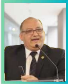
Director Ejecutivo de Transformación Digital para Gobiernos Locales