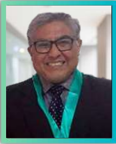
Ing. Civil, Residente en Obras