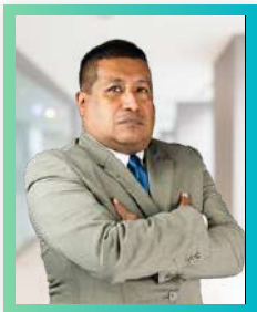
Especialista en Gerencia Pública y Planificación Estratégica