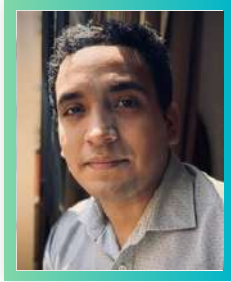
Ex Analista Senior de Mejora Continua en INTERBANK