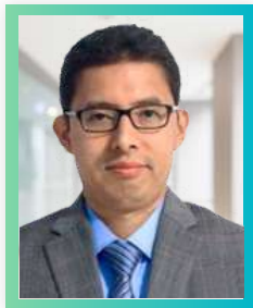
Especialista en Sistemas