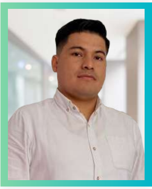
Ingeniero de Gerencia Técnica en China Civil Engineering Construction Corporation