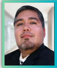
Analista RPA en Canvia